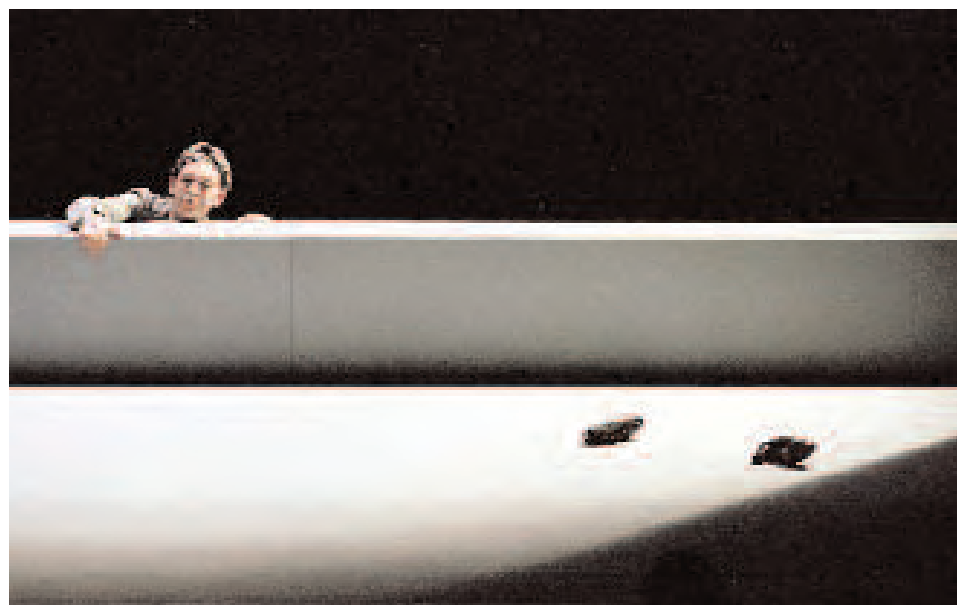
Vertiges - compagnie Le Grain